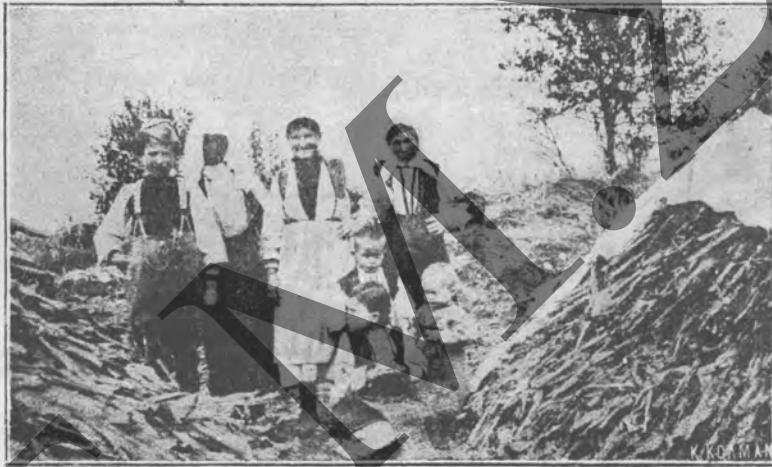
Μακεδονοπούλες μετὰ τὰ γιορτινά τους....

τῆς Κοινότητος Μπόστανης κ. Κουτσαντᾶ, καὶ τὴν ἐπομένην, λίαν πρωΐ, ἐπεστρέψαμεν μέσῳ Βοσσόβηζ εἰς τὴν Κόκκοβαν. Ἐκεῖ, ἀφοῦ ἀνεπαύθημεν ἐπὶ τινὰς ὥρας καὶ ἐγευματίσαμεν, ἀνεχωρήσαμεν ἔπειτα διὰ τὴν Σπουρλίταν.