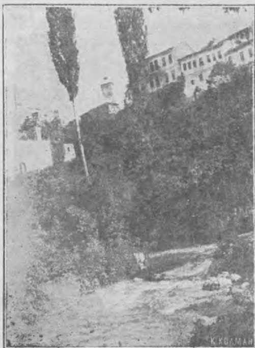
Ἄπ' ὅσα ἀδυνατεῖ νὰ περιγράψῃ ἡ πέννα.