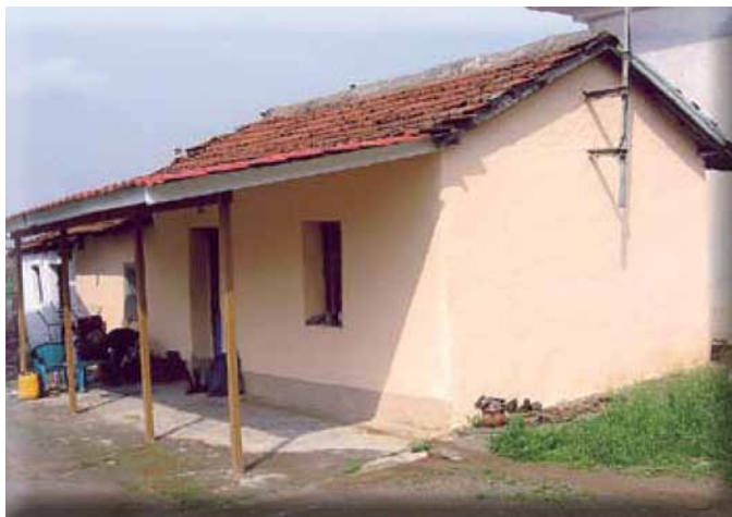
Δίχωρη κατοικία της D.H.T.G. στην Αξό Γιαννιτών, Απρίλιος 2005.

πλήρες προσωπικό, που λειτούργησε όμως μόλις για 2 σχολικά έτη (1920-21 και 1921-22). 1328 Για τον λόγο αυτό οι περισσότεροι Αξενοί, όταν ήρθαν στην Ελλάδα, δε γνώριζαν γράμματα.