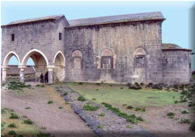
Η εκκλησία της Αγίας Μακρίνας στην Αξό Καππαδοκίας, Μάιος 2005 (Αρχείο Κολιαδήμου Αγνής).

χεία είναι αποκαλυπτικά της μετεξέλιξης του χωριού από έναν μικρό οικισμό στις αρχές του 19ου αιώνα σε ένα από τα μεγαλύτερα χωριά της περιοχής έναν αιώνα αργότερα.