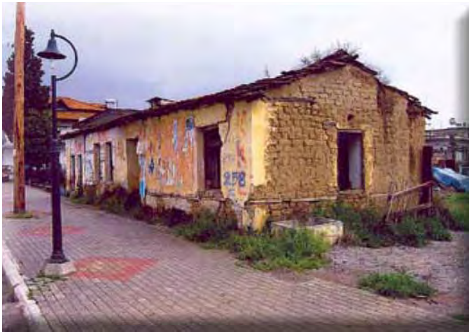
Προσφυγικές κατοικίες της D.H.T.G. στον κεντρικό δρόμο της Αξού Γιαννιτσών, Απρίλιος 2005.

α». 1319 Η «Εφορεία» όρισε 3 Εκκλησιαστικούς Επιτρόπους. Ήταν η πρώτη φορά, αν και για σύντομο χρονικό διάστημα (από τις 25.12.1912 έως τις 12.5.1913), που αναφέρεται απολογισμός για τη διαχείριση της εκκλησιαστικής περιουσίας. Η λειτουργία, όμως, της «Εφορείας» διακόπηκε, πιθανότατα, λόγω της έκρηξης του Α' Παγκοσμίου Πολέμου.