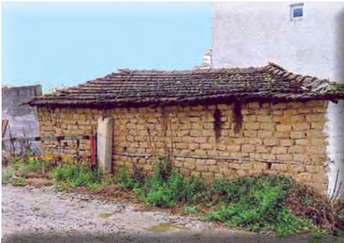
Προσφυγική κατοικία της D.H.T.G. στην Αξό Γιαννιτσών, Απρίλιος 2005.

Χαρακτηριστικό των κατοίκων της Αξού ήταν ότι η πλειοψηφία των εμπορευόμενων δεν εγκαταστάθηκε μόνιμα εκτός Αξού, όπως συνέβαινε στα περισσότερα καππαδοκικά χωριά. Οι περισσότεροι επέστρεφαν κάθε χρόνο, από τον Δεκέμβριο έως το Πάσχα, στην Αξό. Βέβαια, δεν ήταν λίγοι οι Αξενοί που μετανάστευσαν στην Κωνσταντινούπολη, τη Σαμψούντα, τη Μερσίνα, την Άγκυρα, το Άκσεραϊ, τη Σμύρνη, τη Νίγδη, το Καραμάν, τα Άδανα, το Έρεγλι 1309 και σε υπερπόντιες χώρες. 1310 Εκτός Αξού διέμεναν και όσοι διατηρούσαν εμπορικά στα γύρω χωριά. Η μεγαλύτερη παροικία Αξενών εντοπίζεται στο Ικόνιο, στο οποίο εγκαταστάθηκαν, από τα τέλη του 19ου αιώνα, 70 οικογένειες Αξενών εμπόρων. 1311 Επίσης, η πείνα του 1874 ώθησε 30-40 οικογένειες να ιδρύσουν το Μπέι-κιοϊ (Beyköy), τ' Αξενού το χωριό, όπως το έλεγαν, κοντά στο Έρε-