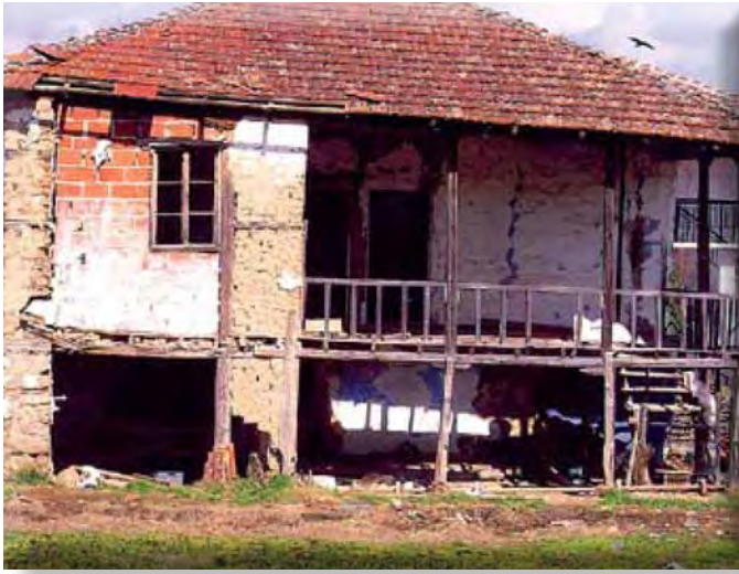
Τουρκική κατοικία στη Χρυσή Αλμωπίας στην οποία εγκαταστάθηκαν πρόσφυγες, Φεβρουάριος 2005.

Αξενοί ήταν επί τουρκοκρατίας χέρσα ή χρησιμοποιούνταν ως βοσκότοποι, ενώ όσα γειτνιάζαν με τη λίμνη των Γιαννιτσών πλημμύριζαν συχνά. 1365 Στη Χρυσή ο κλήρος ήταν ακόμα μικρότερος και ανερχόταν μόλις σε 17 στρέμματα με την προσωρινή και σε 14½ με την οριστική διανομή που έγινε το 1927, ενώ ήταν κατατετμημένος και σε 3 κατηγορίες γαιών. 1366 Η διανομή, μάλιστα, κρίθηκε άκυρη, καθώς έγινε πρόχειρα με βάση αεροφωτογραφίες, αφήνοντας αδιάθετα πολλά χωράφια. Επίσης, ο ποταμός Μογλένιτσας, που ρέει κοντά στο χωριό, πλημμύριζε συχνά τα παραποτάμια χωράφια. 1367 Και στα δύο χωριά οι συνθήκες ευνοούσαν τις αυθαιρεσίες και τις παράνομες εκχερσώσεις ακαλλιέργητων εκτάσεων.