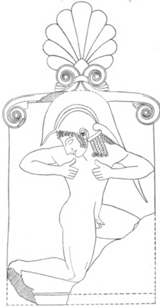
Εἰκ. 2. Ἀναπαράστασις τῆς στήλης.

Ἄτυχῶς τὰ διασωθέντα μνημεῖα εἶναι ὀλίγα καὶ ἐξ αὐτῶν οὐδὲν διετήρησε