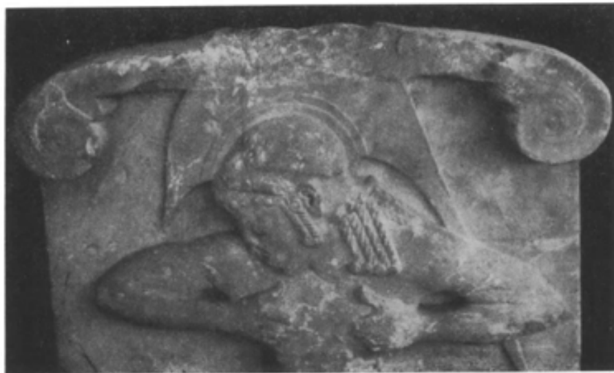
Εἰκ. 1. Τὸ ἄνω τμήμα τῆς στήλης.

Πρὶν ἢ χωρήσωμεν εἰς ἀναπαράστασιν τούτου δυνάμεθα νὰ ἐξαγάγωμεν ἀσφαλές τι συμπέρασμα διὰ τὸ ὑπὸ ἐξέτασιν πρόβλημα. Ἡ ἐπίστεψις αὕτη, οἴαν-δήποτε μορφήν καὶ ἂν εἶχε, τοῦλάχιστον κατὰ τὴν ἀρχὴν τῆς ἤτο συμφυῆς πρὸς τὴν ὑπόλοιπον στήλην καὶ τὸ κατὰ τὴν ἄνω ἐπιφάνειαν τῆς στήλης πλάτος αὐτῆς προσδιορίζεται ἀσφαλῶς ὑπὸ τοῦ σημείου, εἰς ὃ μεταβάλλεται ἡ πορεία τῆς καμπύλης γραμμῆς. Τοῦτο σημαίνει ὅτι οἱ ἀριστερὰ καὶ δεξιὰ ὑπάρχοντες τόρμοι οὐδεμίαν σχέσιν εἶχον πρὸς ὑπερκείμενόν τι μέλος. Ἐφ' ὅσον ὁμως τοῦτο ἀποδεικνύεται ἐκ τῶν πραγμάτων βέβαιον, δὲν ἀπομένει ἄλλη ἐρμηνεῖα διὰ τὴν λειτουρ-