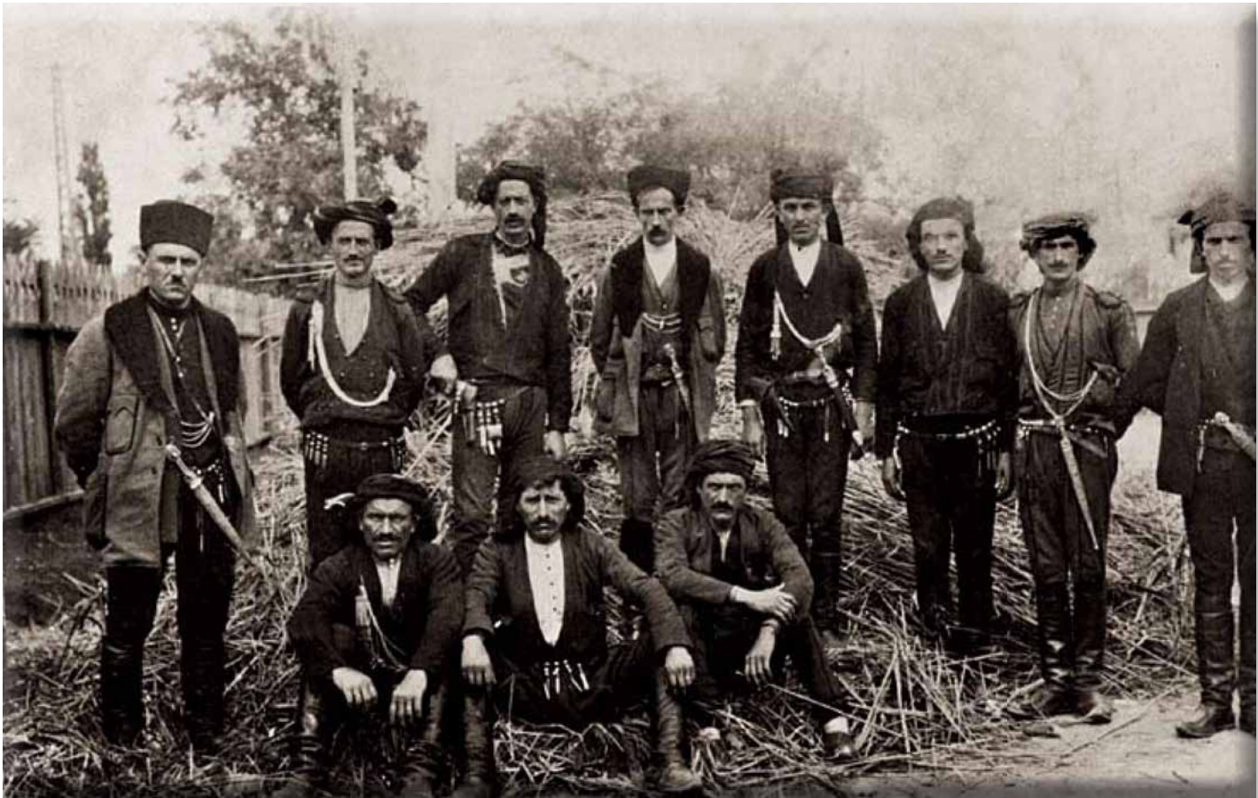
Καρτ ποστάλ που απεικονίζει Πόντιους πρόσφυγες σε χωριό του Νομού Θεσσαλονίκης.

η σύσταση στην Αθήνα «Νοσοκομείου Προσφύγων», το οποίο θα υπαγόταν στην εποπτεία και στον άμεσο έλεγχο του Υπουργείου Υγείας, Πρόνοιας και Αντιλήψεως. 536 Βέβαια, πληροφορούμαστε από τα πρακτικά του ελληνικού κοινοβουλίου ότι αρκετοί βουλευτές είχαν εκφράσει διαμαρτυρίες για πλημμελή λειτουργία του εν λόγω κοινωφελούς ιδρύματος, εξαιτίας της έλλειψης οικονομικής ενίσχυσης. 537