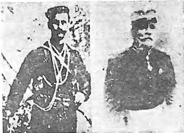
Εἰκόνα 1. Ὁ ἡρωϊκὸς ἀγωνιστὴς Νικόλαος Ι. Δουμπιώτης (ἀριστερά) καί ὁ στρατηγὸς Κοσμάς Δουμπιώτης (δεξιά).

Ἀμόνης Ἀθηνῶν στάλθηκε σάν Ἀρχηγός τοῦ Σώματος στο Νομό Πέλλης καί Ἡμαθίας, ὅπου ἔδρασε μέ τὸ ψευδώνυμο «Καπετάν Ἀμόντας». Ἀργότερα στήν Ἑδεσσα, Γιαννιτσά καί Καρατζόβα μέ τὸ ψευδώνυμο «Ἐπαμεινώνδας» 6 .