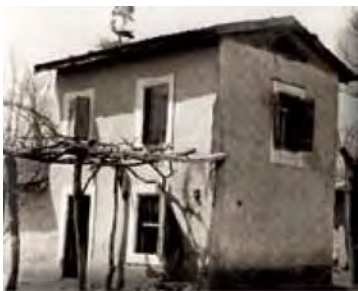
Διώροφη κατοικία (της Ε.Α.Π.) στο Πλατύ Ημαθίας.

ντός της χώρας. Η προσαρμογή των αγροτικών κατοικιών στα ισχύοντα αρχιτεκτονικά πρότυπα (βασική τυπολογία της αγροτικής κατοικίας μιας εκάστης περιοχής) δημιουργεί μια συγκεκριμένη αρχιτεκτονική ταυτότητα των οικισμών αναφοράς. Ειδικότερα για τις ορεινές περιοχές, η τελευταία διακρίνεται κυρίως από τη λιτότητα της εξωτερικής μορφής, τον απόλυτο εναρμονισμό της κατασκευής με το φυσικό περιβάλλον και τη λειτουργική ισορροπία της αρχιτεκτονικής σύνθεσης. Αυτή η προσαρμογή των κατοικιών του ιστορικού χώρου προέλευσης των προσφύγων σε συγκεκριμένα αρχιτεκτονικά πρότυπα, η οποία εκτός των άλλων διαμορφώνει και την ομοιογένεια των οικισμών ως προς τα γενικά χαρακτηριστικά τους, παρατηρείται και στους νέους οικισμούς της εγκατάστασής τους στην προσφυγική Ελλάδα. 965 Ας σημειωθεί επίσης ότι, στα χωριά που έχουν διερευνηθεί στον ιστορικό χώρο προέλευσης, δε συναντά κανείς την εικόνα σαφώς οριοθετημένης οικοδομικής νησίδας. Ωστόσο, όπως προαναφέρθηκε, παρατηρείται η διάρθρωση της λειτουργικής δομής του αγροτικού οικιστικού χώρου σε διακριτές χωρικές ενότητες, γνωστές ως συνοικίες ή μαχαλάδες. Εξάλλου, σε χωρικές ενότητες όχι ιδιαίτερες απομονωμένες και οι οποίες δεν αποτελούν συγκροτημένους οικισμούς με την έννοια μιας αυτοτελούς λειτουργικά (κοινωνικά και οικονομικά) χωρικής μονάδας, συχνά απαντάται ένα ιδιόμορφο συνεχές σύστημα δόμησης: πρόκειται για εν σειρά ενοποιημένες και υπό κοινή στέγη μονάδες κατοικιών, συνήθως συγγενών μεταξύ τους χρηστών. 966