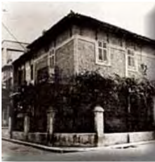
Δίδυμα διώροφα σπίτια.

Ε.Α.Π.), αυτές σχημάτισαν συνοικισμούς διάσπαρτους στις περισσότερες πόλεις της Ελλάδας. 992 Κατά την Ε.Α.Π., «...οι συνοικισμοί αυτοί περιλάμβαναν περίπου 6.000 μικρές κατοικίες, εξαιρουμένων των 500 μεγάλων κτιρίων που υπήρχαν εκεί και που το καθένα τους μπορούσε να στεγάσει 8 έως 10 οικογένειες... Ειδικά στη Θεσσαλονίκη υπάρχουν 4.027 σπίτια με 11.587 δωμάτια, στα οποία διαμένουν 11.179 προσφυγικές οικογένειες. Στις πόλεις Σέρρες, Δράμα, Καβάλα, Έδεσσα, Νάουσα και Βέροια υπάρχουν 7.255 σπίτια με 2,5 δωμάτια κατά μέσο όρο το καθένα. Όλα αυτά κατοικούνται από πρόσφυγες, χωρίς να πληρώνεται ενοίκιο...». 993 Οι κατοικίες αυτές, σε πολλούς από τους συνοικισμούς που κατασκεύασε το κράτος, ήταν από υλικά ευτελή: ξύλινες σε πολλές περιπτώσεις ή από ωμές πλίνθους, με στέγη κεραμοσκεπή, εκτός των περιπτώσεων που η επικάλυψη γινόταν με λαμαρίνες ή σανίδες ξύλου (η τελευταία περίπτωση ήταν συνηθέστερη στις προσωρινές κατοικίες –εν είδει παραπήγματος- οι οποίες είχαν προοπτική βελτίωσης στη συνέχεια). Η Ε.Α.Π. συνέχισε την κατασκευή κατοικιών στους συνοικισμούς αυτούς χρησιμοποιώντας βελτιωμένα υλικά, όπως πέτρες, τούβλα, τσιμέντο ή τσιμεντόλιθους για την τοιχοποιία και απαραίτητως για την επικάλυψη της στέγης, κεραμίδια. Πολλά από τα σπίτια σχεδιάστηκαν έτσι, ώστε να εξυπηρετούν τις ανάγκες