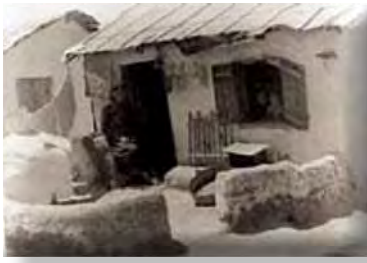
Πρώτες εγκαταστάσεις προσφύγων γύρω από την Αθήνα.

νεια ως προς το κοινωνικό περιβάλλον του ίδιου του αστικού προσφυγικού συνοικισμού. 943