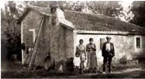
Αγροτική κατοικία στο Πλατύ Ημαθίας.

ποικιλίας των τύπων εγκατάστασης που είχαν επικρατήσει, είναι το απόσπασμα που ακολουθεί, προερχόμενο από εκθέσεις της Ε.Α.Π.: 955