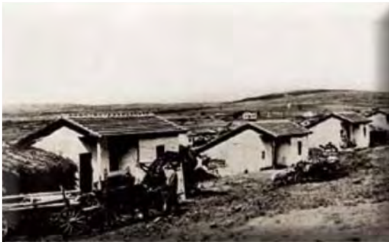
Αγροτικές κατοικίες τύπου Δεχάτεγκε, Μαυρονέρι Νομού Κιλκίς.

μέσα στην ίδια περιοχή αναλόγως της θέσης, συναρτάται για τις προσφυγικές αυτές εγκαταστάσεις όχι μόνο με τα ποιοτικά χαρακτηριστικά του εδάφους, αλλά κυρίως με την υπάρχουσα υποδομή (π.χ. το μεταφορικό δίκτυο) καθώς και με την απόσταση της αγροτικής εγκατάστασης από υπάρχον αστικό κέντρο. 974 Σύμφωνα με τις εκτιμήσεις της Επιτροπής, η γη επί το πλείστον διαιρέθηκε με τρόπο, ώστε «να διασφαλίζεται η αξιοπρεπής διαβίωση των σκληρά εργαζομένων αγροτών προσφύγων». 975