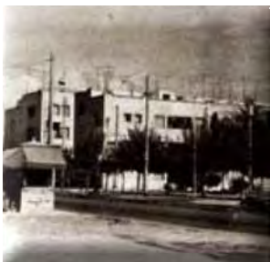
Προσφυγικές αστικές πολυκατοικίες.

κατοίκων) της Αθήνας, του Πειραιά ή της Θεσσαλονίκης παρατηρείται το φαινόμενο σχετικής ομοιομορφίας των κατοικιών σε πολεοδομική διάταξη εν είδει ορθογωνικού καννάβου που επέτρεπε την κατανομή ίσων οικοπέδων και τη μαζική οικοδόμηση, γεγονός το οποίο παραπέμπει μάλλον σε εικόνα συλλογικής εγκατάστασης ή στρατοπέδου. Αξιοσημείωτο επίσης είναι ότι, στους τέσσερις συνοικισμούς της Αθήνας, η Επιτροπή έχτισε –βάσει των τυπολογικών προδιαγραφών σχεδιασμού που προαναφέρθηκαν- σχολεία και υγειονομικούς σταθμούς ή και νοσοκομεία, με στόχο την οργάνωση του κάθε αστικού συνοικισμού σε αυτοδιοικούμενη κοινότητα, η οποία τελικώς έμελε να ενταχθεί στο δήμο όπου ανήκε. 1002