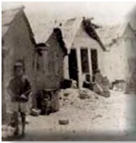
Πρώτες εγκαταστάσεις προσφύγων γύρω από την Αθήνα.

επηρεάζουν την εξέλιξη του δικτύου των οικισμών της χώρας». 933 Η εποικιστική πολιτική της αντίστοιχης περιόδου κρίνεται μάλλον αποσπασματική, τα δε θεσμικά εργαλεία που αναφέρονται σχετικά (ψηφίσματα ή νόμοι), φαίνεται ότι προκύπτουν κατά περίπτωση. Το προσφυγικό ζήτημα εισέρχεται σε ιδιαίτερος κρίσιμη περίοδο για τη χώρα με την απαρχή του 20ού αιώνα, όταν παρατηρούνται και οι έντονες πλέον μετακινήσεις πληθυσμών, επακόλουθο των Βαλκανικών Πολέμων αρχικά και της μικρασιατικής ήττας και καταστροφής στη συνέχεια. Τότε, το πλαίσιο των ρυθμίσεων επαναπροσδιορίζεται και οι προσπάθειες σχεδιασμού τίθενται σε νέα βάση.