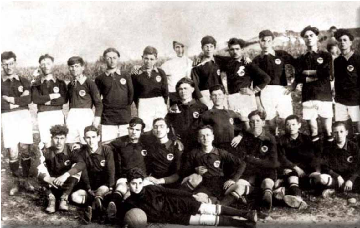
Η ομάδα του αθλητικού και μορφωτικού συλλόγου «ο Αγροτικός Αστήρ Νέου Κουκλουτζά», 1934, Συλλογή Αγγελίδου.

μόνο τον συναισθηματικό δεσμό με την ιστορική πατρίδα και τη μείζονα σημασία που απέδιδαν επομένως οι πρόσφυγες στην πατρογονική εστία, αλλά και την αναζήτηση καταφυγίου για ασφάλεια και κοινωνική αυτοεκτίμηση. 1258