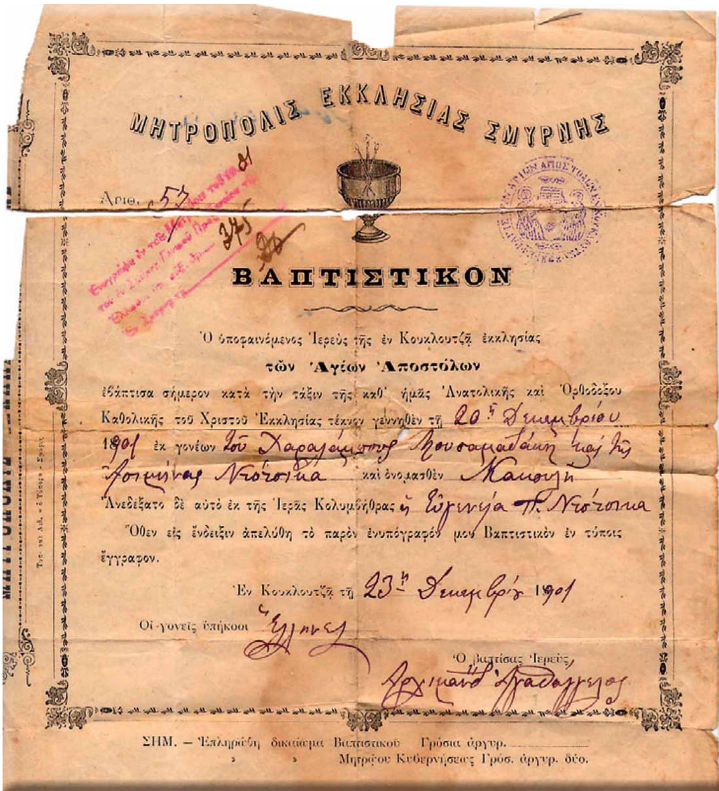
Έγγραφο βάπτισης στον Ι.Ν. Αγίων Αποστόλων Κουκλουτζά Μ. Ασίας, 1903, Συλλογή Παπαπέτρου.

άλλους πρόσφυγες κατευθύνθηκαν στη Μυτιλήνη, τη Χίο, τη Σάμο, το Ηράκλειο της Κρήτης, τον Πειραιά και τη Θεσσαλονίκη. 1243 Στη Θεσσαλονίκη αρκετές οικογένειες Κουκλουτζαλήδων έμειναν αρχικά στο κέντρο, ώσπου επιτροπή τους μαζί με αρμόδιους υπαλλήλους του Εποικισμού Μακεδονίας επέλεξαν, όπως προαναφέραμε, ως κατάλληλο τόπο για την εγκατάστασή τους το Παλαιό Χαρμάνκιοι.