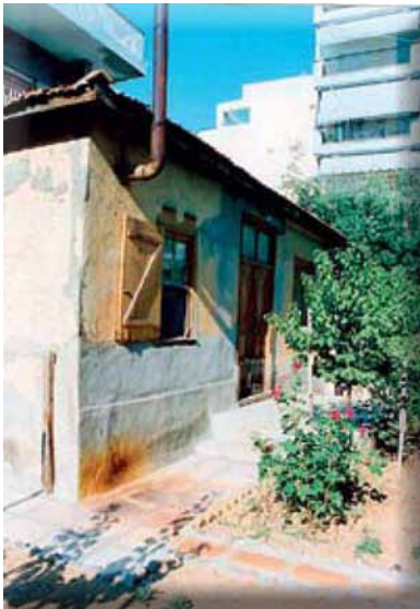
Εξωτερική άποψη προσφυγικής κατοικίας.

κάτοικος, ανεξαρτήτου καταγωγής, θα κατείχε και θα καλλιεργούσε. 1250 Προς επίρρωση των παραπάνω, αρκεί να αναφερθεί ότι γηγενείς και πρόσφυγες όχι μόνο άρχισαν πολύ σύντομα να συναλλάσσονται οικονομικά (αγορά και πώληση γάλακτος, δόμηση οικιών και στάβλων κ.λ.π.), αλλά και συνήψαν φιλικές σχέσεις μεταξύ τους, που δεν άργησαν να φθάσουν και στους γάμους των παιδιών τους, ήδη από τις αρχές της δεκαετίας του 1930. 1251 Επίσης, το δημοτικό σχολείο αναμφίβολα αποτέλεσε από την πρώτη στιγμή βασικό παράγοντα ομογενοποίησης και «συμφιλίωσης» της ετερόκλητης σύστασης του πληθυσμού, αφού στις αίθουσές του στέγασε όλα τα παιδιά, των γηγενών και των προσφύγων. Διακρίσεις και διαχωρισμοί δεν παρατηρήθηκαν ούτε μεταξύ των προσφύγων. Οι ελάχιστες ποντιακές οικογένειες διαφοροποιούνταν μόνο ως προς τη διάλεκτο και το εδεσματολόγιό τους, ενώ σε όλες τις εκφάνσεις της καθημερινής ζωής συμμετείχαν το ίδιο ενεργά με τους υπόλοιπους κατοίκους. 1252